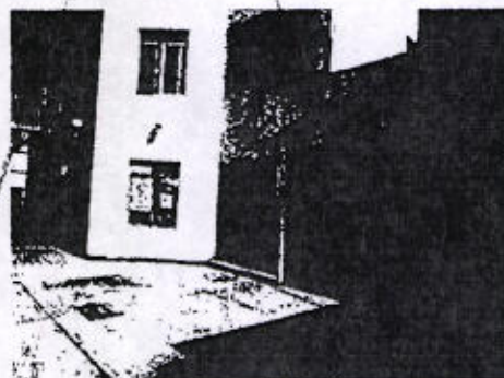
Instalaciones de la Penitenciaría de Ixcotel