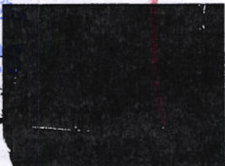
Libro de registro de la Penitenciaría de Ixcotel