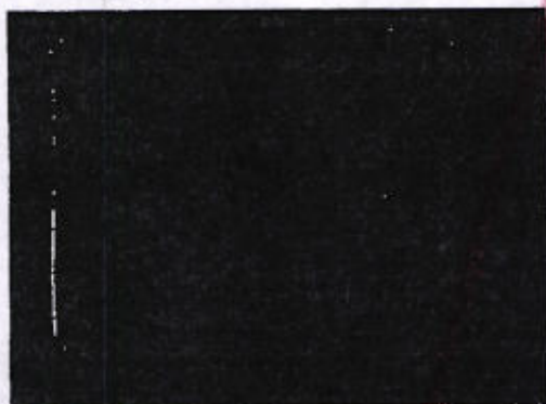
Libro de registro de la Penitenciaría de Ixcotel