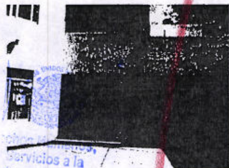
Instalaciones de la Penitenciaría de Ixcotel