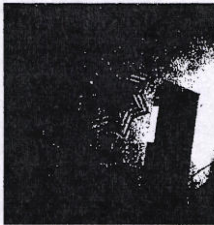
Área en donde funcionaron las instalaciones del Reclusorio Asunción Noachixtlan