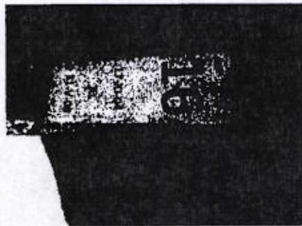
Libro de registros de la Penitenciaría de Ixcotel