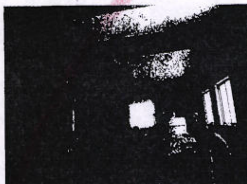
Instalaciones del Centro de Reinserción Social Centro de Internamiento de Etla