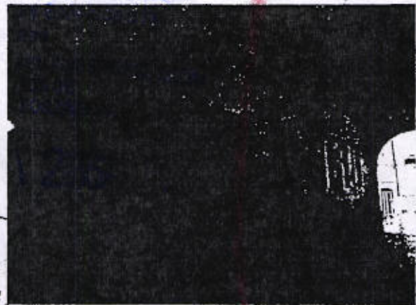
Palacio Municipal de Asunción Nochixtlan